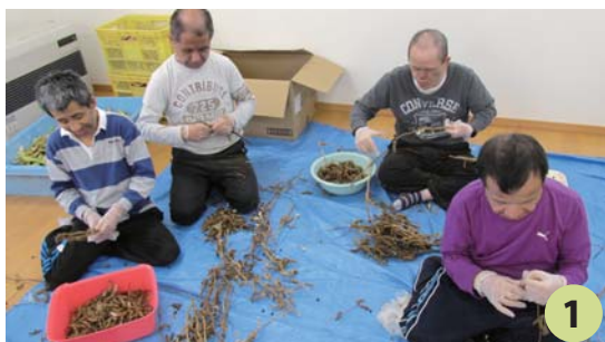
作業棟ゆこむでの豆のカラ取り選別作業

午後は主に作業で、年間を通して新聞やチラシを畳む、リサイクル作業や企業から委託を受けて、月に 2～3 回程度、観光地のお土産用お菓子の箱詰め作業も行っています。春から秋にかけての畑作業では、トラ豆等の菜豆、枝豆やとうきびや芋を栽培し、冬季は菜豆の選別などの作業（写真 1）もしています。