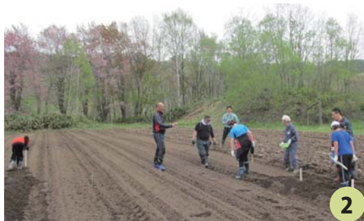
5月に行う小学生との芋植え

春にイモの植付（写真 2）、案山子作り、夏の収穫、値札作り、そして試食と一連の交流活動を 6 年間続けています。これらの作業を通じて利用者と小学生の距離が近くなったと思います。