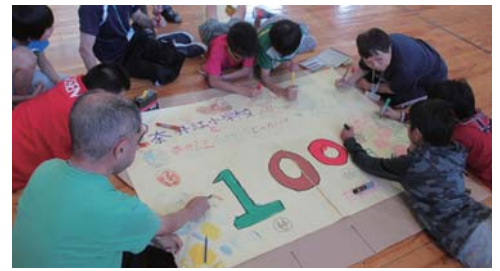
ポテトプロジェクト：小学生との値札作り