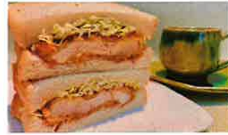
みみずくの「カツサンド」コスパ最強！