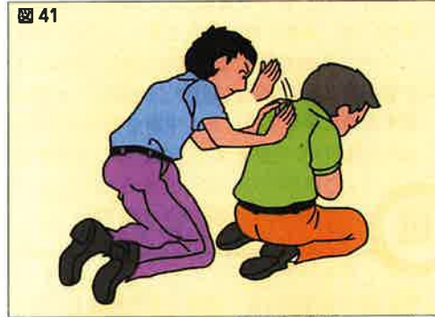
背部叩打法(傷病者の後方から手のひらの付け根で肩甲骨の間を力強く何度も連続して叩く)