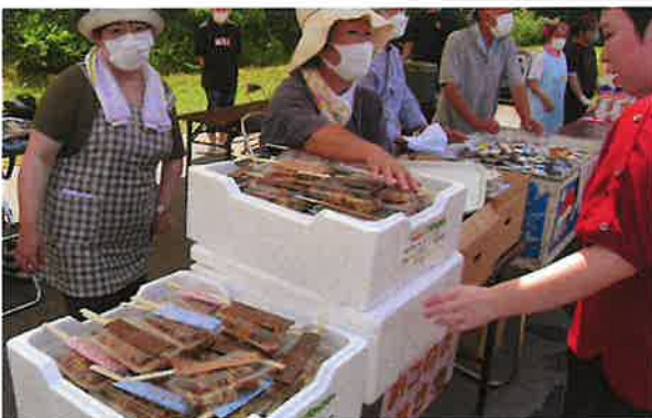
焼きそば・焼き鳥美味しいよ！

令和2年度より新型コロナウイルス感染症の拡大防止の為、お祭を中止していましたが、今年は4年振りにないえ福祉会の関係者のみでの縮小した形で「2023 ないえ福祉会祭」を7月8日（土）開催することが出来ました。