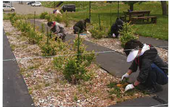
ブルーベリー畑のスギナ取り

前日に花苗を片桐農園から購入し、散水に用いるホース、移植に使うシャベルや手ぐわを準備して当日を待ちました。保護者の方は手際よくお花の苗を整列させた後、移植していました。定着するか心配だったのですが、ほぼ全て植えた苗は定着しました。